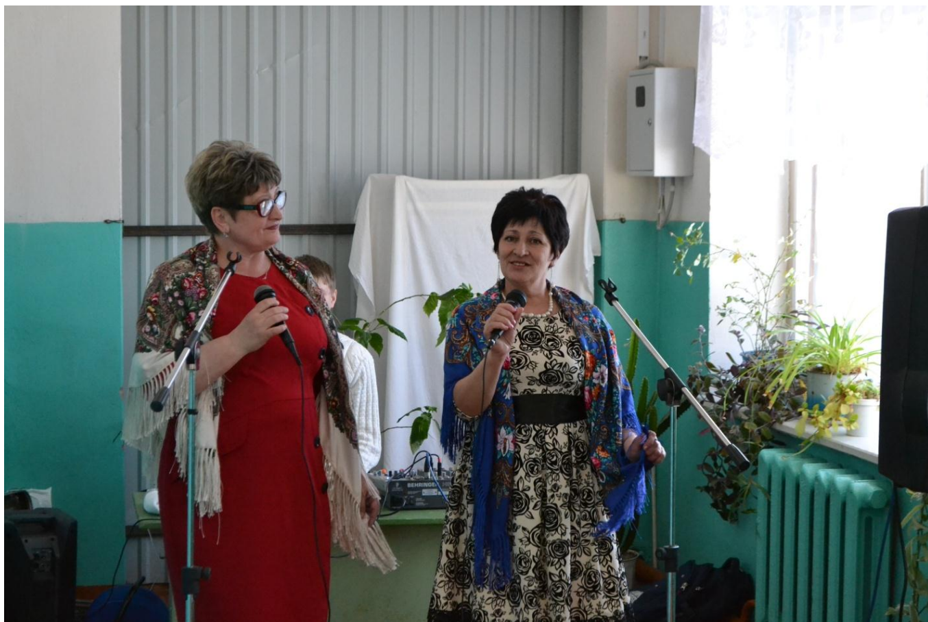
Коллектив «Росинка» в неполном составе исполняет песню «Старый клён».