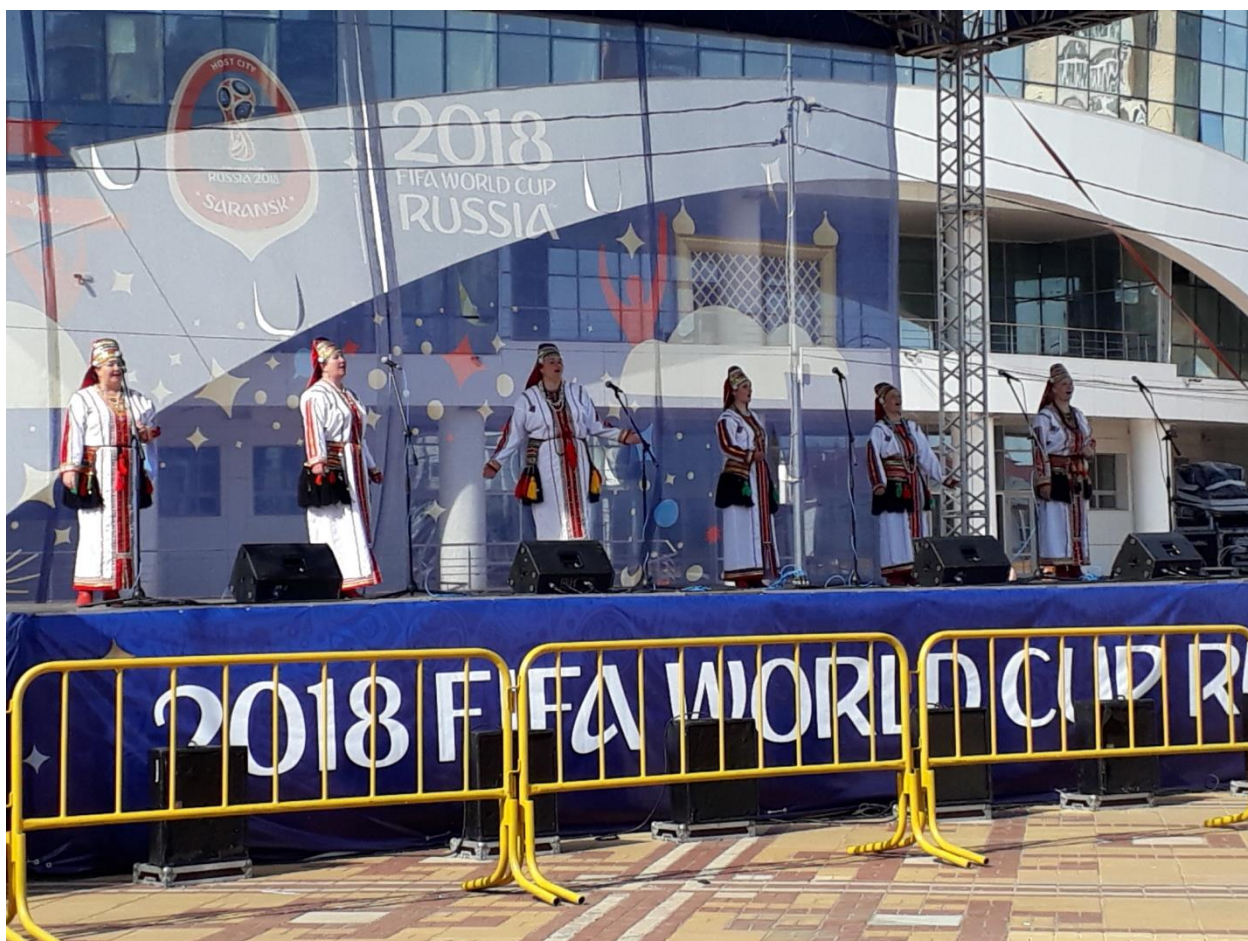
Народный ансамбль «СЫРНЕНЬ СУРКСКЕ»