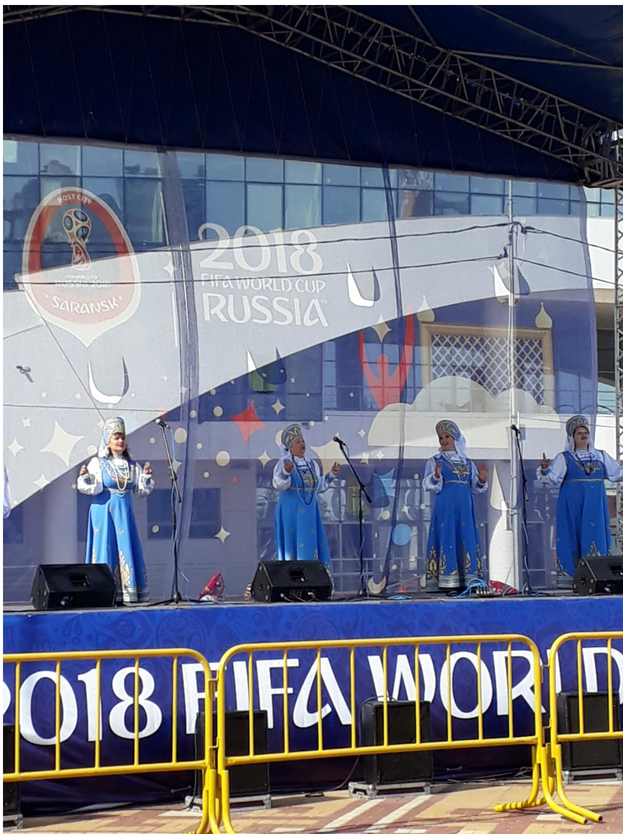
Народный ансамбль «РОССИЯНОЧКА»